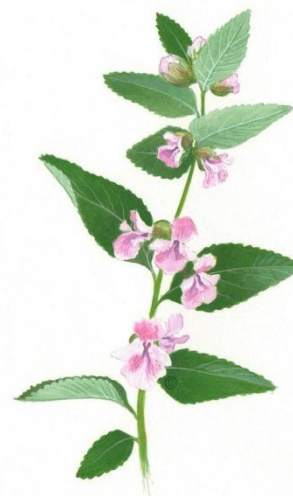
Aquarelle de Richard Mongenet