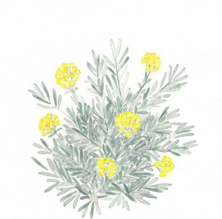
Aquarelle de Richard Mongenet